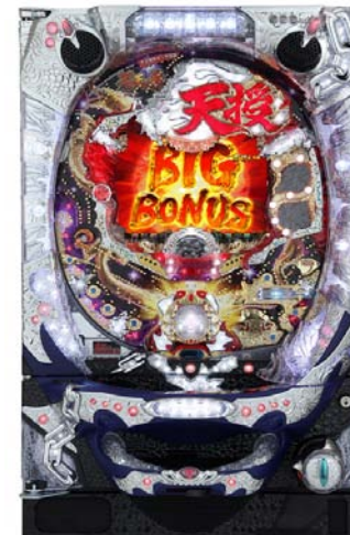
『ぱちんこCR蒼天の拳 天授』 (サミー)