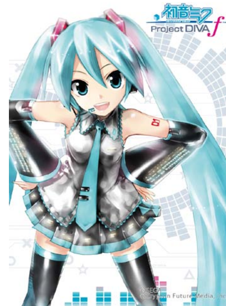
『初音ミク -Project DIVA- f』

TM IOC/USOC 36USC220506. Copyright © 2012 International Olympic Committee ("IOC"). All rights reserved. This video game is the property of the IOC and may not be copied, republished, stored in a retrieval system or otherwise reproduced or transmitted, in whole or in part, in any form or by any means whatsoever without the prior written consent of the IOC.