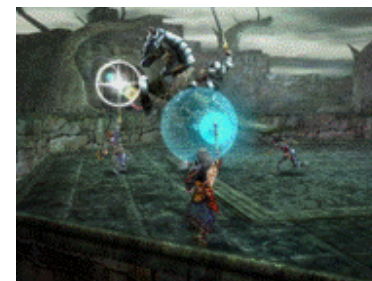
『Kingdom Conquest II (キングダムコンクエストII)』