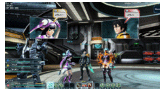
『ファンタシースターオンライン2』