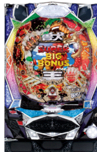
『ぱちんこCR神獣王』 (サミー)