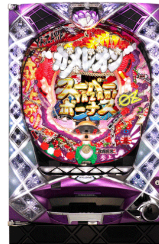
『CRカメレオン』 (タイヨーエレクト)