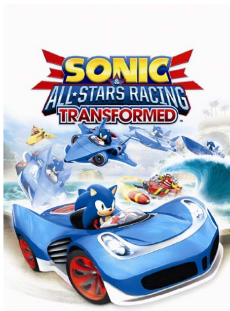
『Sonic & All-Stars Racing Transformed』