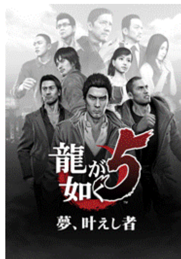
『龍が如く5 夢、叶えし者』