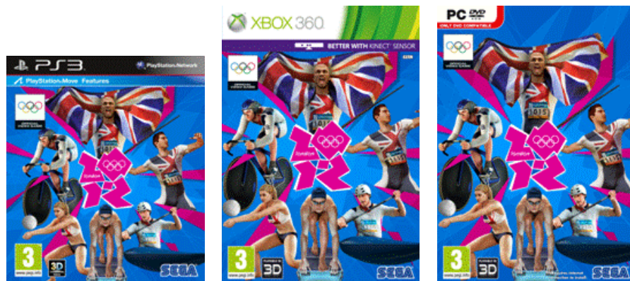
『London 2012: The Official Video Game of the Olympic Games』

TM IOC/USOC 36USC220506. Copyright © 2012 International Olympic Committee ("IOC"). All rights reserved. This video game is the property of the IOC and may not be copied, republished, stored in a retrieval system or otherwise reproduced or transmitted, in whole or in part, in any form or by any means whatsoever without the prior written consent of the IOC.