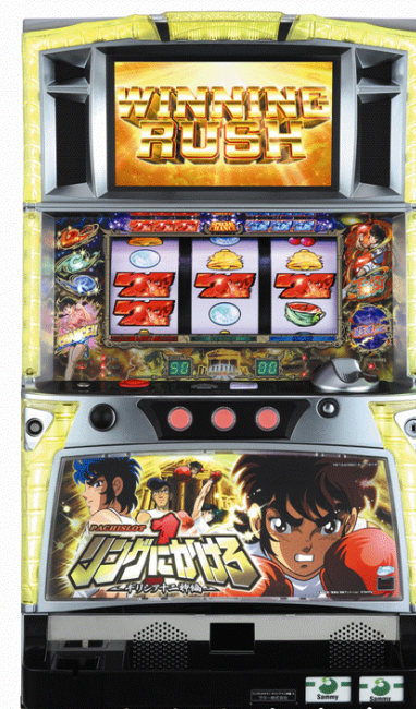
『パチスロリングにかける1 ギリシア十二神編』 (サミー)