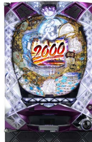
『CR兎ー野性の闘牌ー』 (タイヨーエテック)